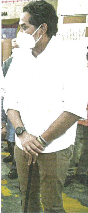
Health Minister Khairy Jamaluddin (right) speaking to people at the Dewan Datuk Mohd Taha vaccination centre in Gemencheh, Tampin, Negri Sembilan, yesterday.

Kuala Lumpur and Selangor had achieved the same or higher vaccination coverage as Negri Sembilan.