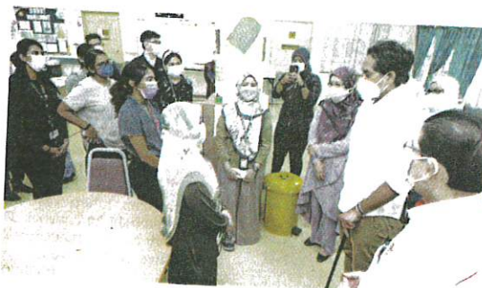
KHAIRY JAMALUDDIN (kanan) bertemu dengan kakitangan dan petugas di Hospital Tampin, Tampin semalam.

Beliau berkata demikian ketika ditemui sempena lawatan di Hospital Tampin, di sini semalam.