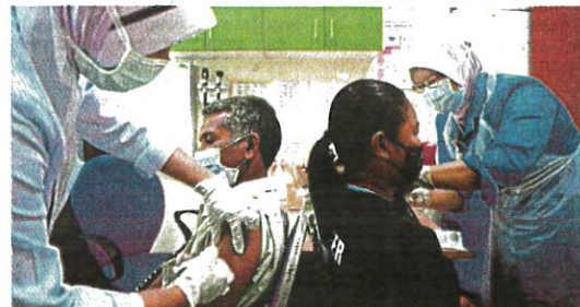
Kerajaan negeri memperluas imunisasi secara terus ke hampir seluruh daerah bagi mempercepat jumlah penduduk dewasa divaksin. (Foto hiasan)

"Program ini memberi tumpuan di luar bandar, kawasan sukar menerima akses internet atau jauh dari bandar bagi membantu rakyat mendapatkan suntikan vaksin," katanya.