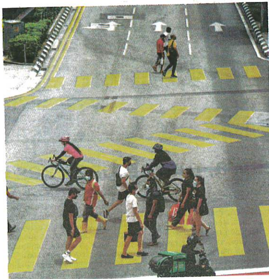
ORANG ramai melalui lintasan pejalan kaki ala 'Shibuya Crossing' di Bukit Bintang, Kuala Lumpur semalam.

Sementara itu, beliau berkata, sebanyak 19,057 kes baharu dilaporkan semalam, menjadikan jumlah kes